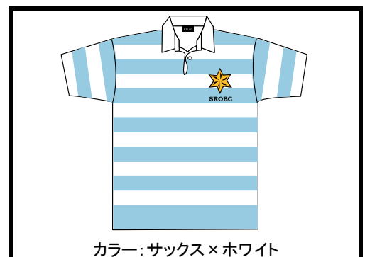
カラー: サックス×ホワイト